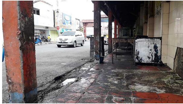
Gambar 6. Kondisi trotoar dengan genangan air dan sisa minyak goreng