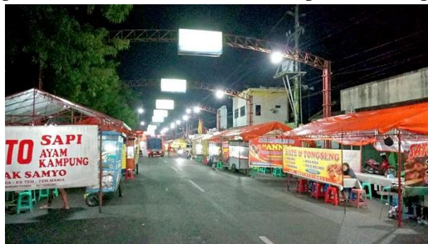
Gambar 4. Tipologi lapak dan tenda

Transformasi ruang ini juga menunjukkan kemampuan adaptif masyarakat terhadap dinamika ekonomi kota. Para pedagang kaki lima memanfaatkan ruang publik secara efisien dengan menggunakan material ringan dan struktur portabel yang mudah dipasang serta dibongkar. Elemen-elemen arsitektural seperti rangka besi, terpal warna-warni, meja lipat, dan kursi plastik membentuk citra visual yang informal namun khas. Pola berulang dari tenda dan peralatan dagang menciptakan ritme spasial yang dapat dibaca sebagai bentuk “arsitektur rakyat” sebuah morfologi urban yang tumbuh dari kebutuhan, bukan dari rancangan formal. Kondisi ini memperlihatkan bentuk vernakularitas baru yang tidak hadir dalam wujud rumah tradisional, melainkan melalui ekspresi ruang publik kontemporer yang hidup, dinamis, dan senantiasa beradaptasi terhadap perubahan.