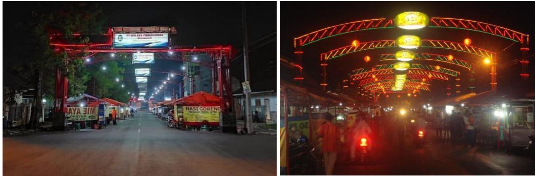
Gambar 7. Suasana pencahayaan malam di koridor Kya-Kya Mayong

bagaimana bentuk fisik dan kehidupan manusia saling mengisi, menciptakan pengalaman ruang yang kaya dan bermakna.