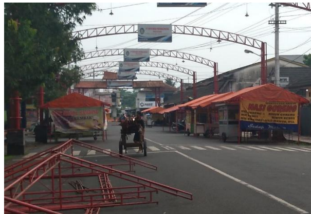
Gambar 2. Koridor Gang Mayong menjelang malam, suasana persiapan pedagang

Pada siang hari, Gang Mayong berfungsi sebagai jalur pergerakan menuju permukiman dan area olahraga, dipenuhi lalu lintas kendaraan roda dua dan aktivitas warga sekitar. Namun menjelang senja, suasana mulai berubah—pedagang kaki lima berdatangan, membuka tenda, menata meja, dan perlahan mengisi trotoar dengan aroma masakan dan cahaya lampu. Ruang yang tadinya tenang pun beralih menjadi lanskap sosial yang hidup. Perubahan ini terjadi berulang setiap hari, menciptakan ritme temporal yang menjadi bagian dari denyut keseharian kota kecil: sebuah bentuk adaptasi ruang yang lahir dari interaksi antara kebutuhan ekonomi, kebiasaan sosial, dan daya hidup komunitasnya.