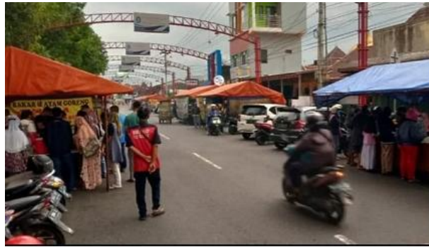
Gambar 5. Aktivitas sosial dan interaksi antara pedagang dan pengunjung di kawasan Kya-Kya Mayong

Di sini, pedagang dan pengunjung tidak hanya bertemu untuk transaksi, tetapi juga saling mengenal dan menumbuhkan hubungan informal yang dibangun atas dasar kepercayaan. Ruang publik ini menjadi saksi kuat fungsi sosial arsitektur: ia hadir sebagai tempat pertemuan, sekaligus simbol keterbukaan dan interaksi. Fenomena ini menegaskan bahwa kualitas sebuah ruang kota tidak hanya diukur dari bentuk fisiknya, melainkan dari intensitas kehidupan manusia yang mengisi setiap sudutnya, sebagaimana diperlihatkan oleh pemikiran Gehl (2010).