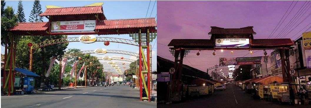
Gambar 3. Perbandingan kondisi siang dan malam hari di Gang Mayong

dan hangat. Pergeseran dari siang ke malam melahirkan pengalaman ruang yang sepenuhnya berbeda: dari koridor fungsional menjadi lanskap sosial yang penuh warna, aroma, dan bunyi, menegaskan bahwa ruang kota sesungguhnya hidup melalui aktivitas manusia yang mengisinya.