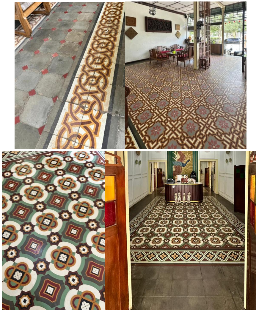
Gambar 4 Pola dan Motif Lantai pada Bangunan Roti Mruyung