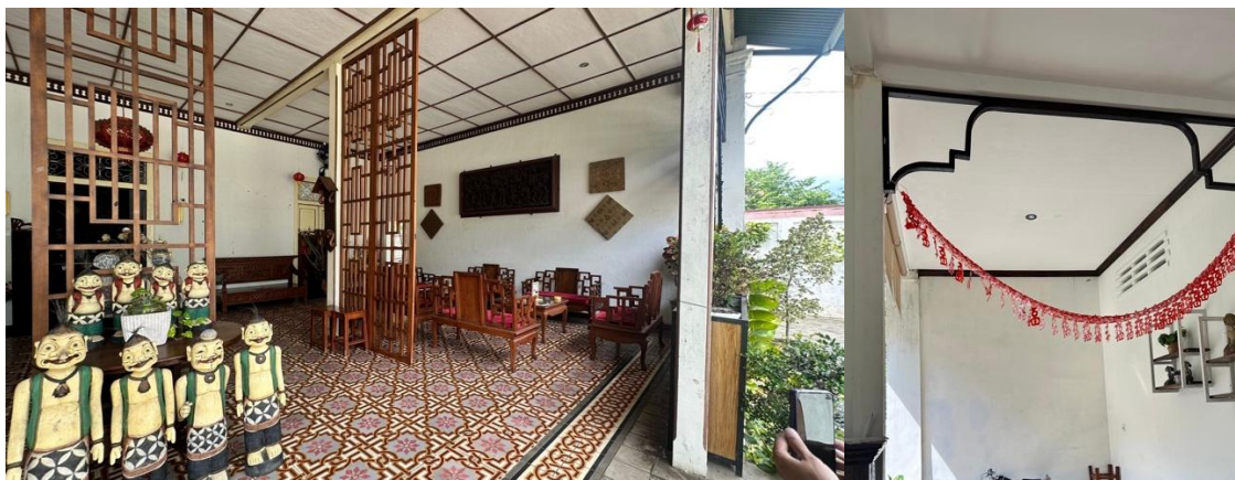
Gambar 5 Ornamen pada Bangunan Roti Mruyung