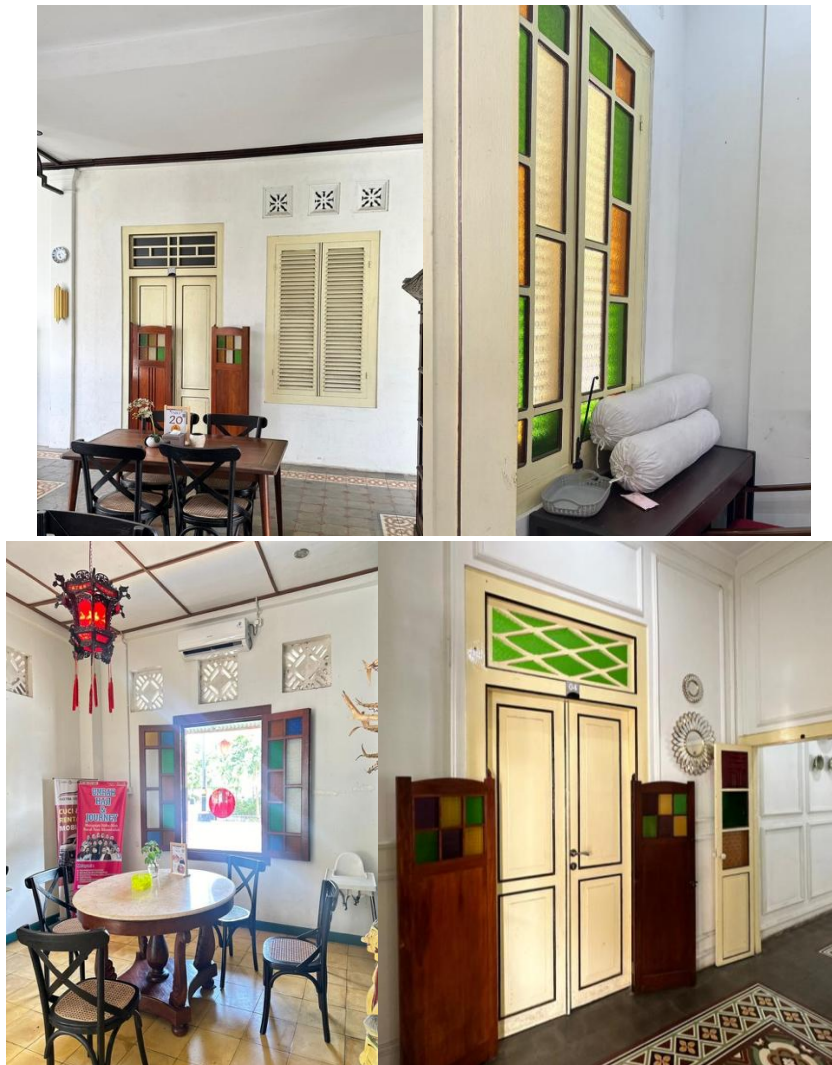
Gambar 3 Pintu dan Jendela pada Bangunan Roti Mryung