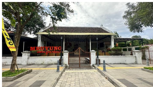
Gambar 2 Tampak Depan Bangunan Roti Mruyung