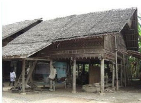
Gambar 5. Rumoh aceh yang masih asli

Seiring perkembangan zaman yang menuntut semua hal dikerjakan secara efektif dan efisien, serta semakin mahalnya perawatan bangunan yang berbahan kayu apalagi Rumoh Aceh, maka lambat laun memaksa masyarakat untuk meninggalkan dalam penggunaan rumah aceh ini. Akibatnya, rumah aceh semakin hari semakin sedikit keberadaannya. Walaupun keberadaannya kian sedikit, namun pemakaian arsitektur rumah aceh tidak serta merta ditinggalkan begitu saja. Ada juga masyarakat yang masih menggunakan arsitektur aceh ke dalam bangunannya.