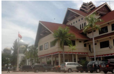
Gambar 11. Kantor Bupati Aceh Utara

Pengadopsian arsitektur rumah juga terlihat pada bangunan pemerintahan.