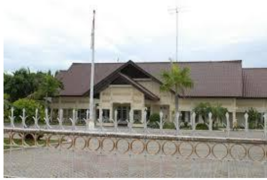
Gambar 13. Pendopo Aceh Utara