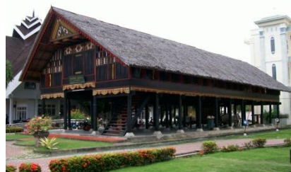
Gambar 2. Rumoh Aceh

Rumoh aceh bukan sekedar hunian, tetapi sebagai ekspresi dari keyakinan terhadap tuhan dan adaptasi terhadap alam. Rumoh aceh senantiasa memanjang dari