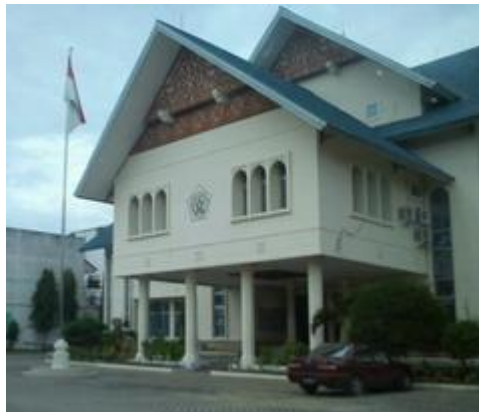
Gambar 12. Kantor Walikota Lhokseumawe

Pada kantor Bupati dan Kantor Walikota ini, penerapan arsitektur rumah aceh terlihat pada atap. Penggunaan ornamen rumah aceh juga terlihat walaupun hanya sebagian kecil pada atap dan selubung balok. Selain itu, penggunaan tiang-tiang menyerupai rumah aceh juga masih terlihat pada fasadenya sehingga Tiang-tiang ini menghasilkan kesan “panggung”.