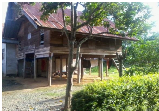
Gambar 8. Hunian