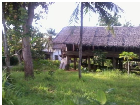
Gambar 9. Hunian