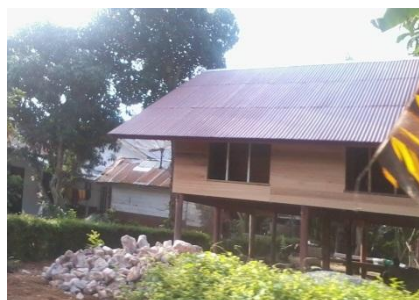
Gambar 10. Hunian

Transformasi pemakaian rumah aceh ke dalam kehidupan masyarakat semakin hari semakin pudar. Hal ini terlihat pada bentuk fasade yang tidak sepenuhnya mengadopsi rumah aceh. walaupun tetap mempertahankan bentuk panggung, namun