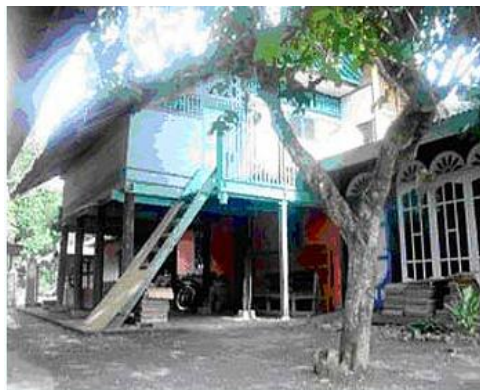
Gambar 6. Rumoh aceh berdampingan dengan rumah beton