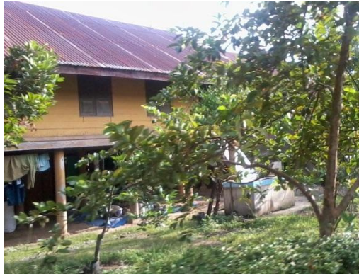
Gambar 7. Hunian