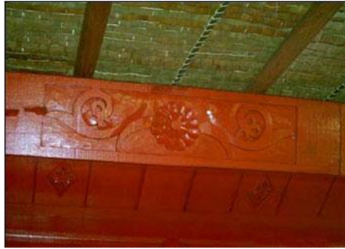
Gambar 4. Hiasan pada atap rumoh aceh