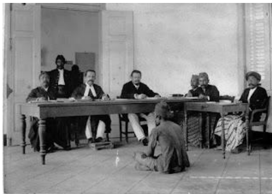
Gambar 6. Ruang Pelayanan yang Dulunya Ruang Persidangan