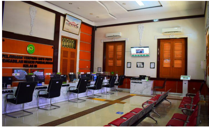
Gambar 5. Ruang Pelayanan Masa Sekarang

berdasarkan penuturan bapak Puryanto, ruang pelayan sekarang yang dulunya adalah ruang sidang utama.