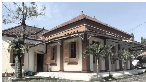
Gambar 2. Fasad Bangunan Tahun 2016

Bentuk fasad bangunan Landraad te Purbalingga mengalami beberapa transformasi. Sebelum tahun 2016 bangunan ini mendapat perubahan pada fasad untuk pertama kalinya, dimana tulisan di atas bangunan diubah menjadi ‘ Pengadilan Negeri ‘. Bentuk fasad bangunan Landraad dimasa sekarang banyak mengalami penambahan yang mengakibatkan sedikit perubahan dikarenakan adanya renovasi kedua pada bangunan yang dilaksanakan antara tahun 2020 hingga 2022 yang dimana elemen – elemen kolonial yang sempat hampir pudar pada renovasi awal kembali dimunculkan kembali.