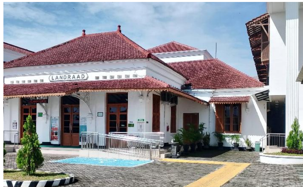
Gambar 3. Fasad Bangunan Saat Ini

Secara kasat mata, bentuk fasad bangunan Landraad hasil renovasi kedua hampir mengembalikan bentuk bangunan seperti bangunan seperti bentuk awal mulanya. Namun, dengan tambahan dua bangunan pada sisi kanan kiri bangunan yang menjadi pembeda. Fasad gedung Landraad te Purbalingga pada era kolonial adalah struktur kecil satu lantai dengan gaya kolonial yang kuat, ditandai dengan jendela besar serta atap dan plafon tinggi, yang hingga saat ini masih dipertahankan dengan baik pada bangunan tersebut.