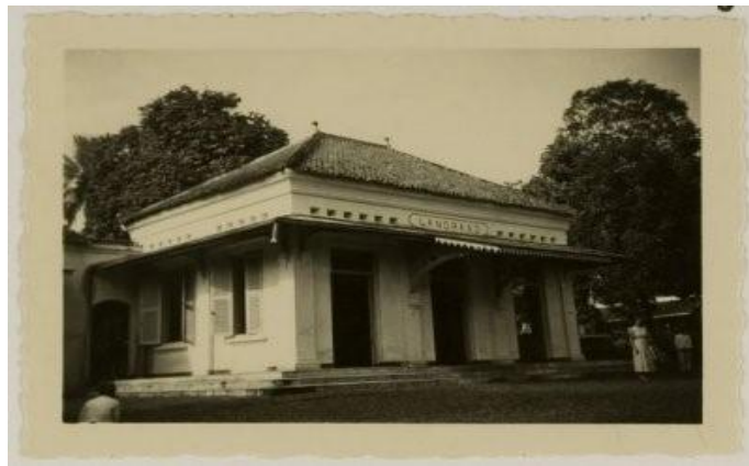
Gambar 4. Fasad Pada Zaman Dahulu ( sumber : Saputra, 2020 )

Secara kasat mata, bentuk fasad bangunan Landraad hasil renovasi kedua hampir mengembalikan bentuk bangunan seperti bangunan seperti bentuk awal mulanya. Namun, dengan tambahan dua bangunan pada sisi kanan kiri bangunan yang menjadi pembeda. Fasad gedung Landraad te Purbalingga pada era kolonial adalah struktur kecil satu lantai dengan gaya kolonial yang kuat, ditandai dengan jendela besar serta atap dan plafon tinggi, yang hingga saat ini masih dipertahankan dengan baik pada bangunan tersebut.