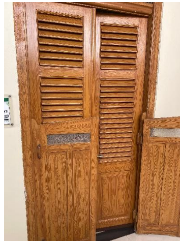
Gambar 10. Pintu Landraad te Purbalingga ( sumber : dokumentasi Pribadi, 2025 )

Pintu pada bangunan pengadilan negeri Purbalingga masih menggunakan model pintu dua daun pintu besar bermaterial kayu jati dengan style vintage yang dimana model pintu masih seperti bentuk awalnya.