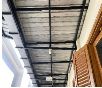
Gambar 9. Kanopi Pada Bangunan Landraad

Adapun aspek – aspek bangunan Landraad yang masih lestari dan dipertahankan oleh bangunan Landraad te Purbalingga seperti :