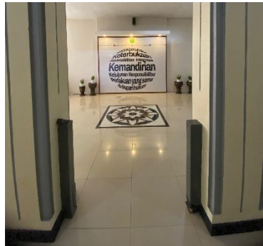
Gambar 7. Lantai Landraad Sekarang