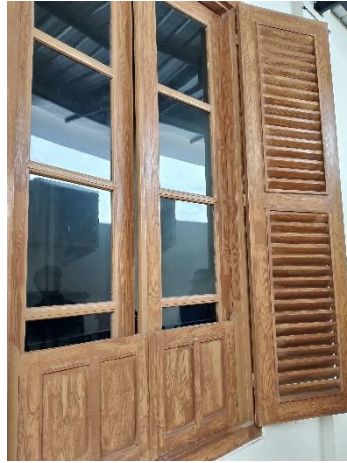
Gambar 11. Jendela Landraad te Purbalingga