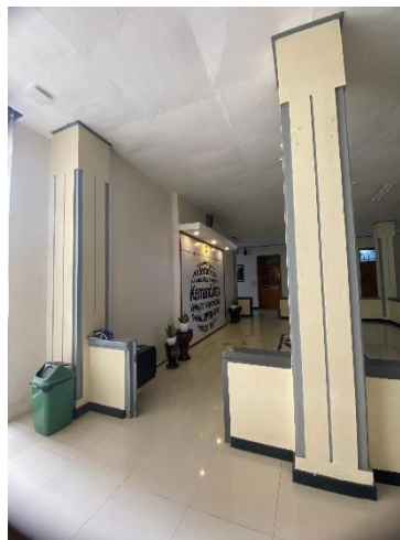
Gambar 12. Kolom Landraad te Purbalingga

Kolom pada bangunan landraad te Purbalingga menggunakan material beton dengan bentuk persegi yang dimana di setiap sudutnya memiliki aksan vertikal yang simpel dan minimalis.