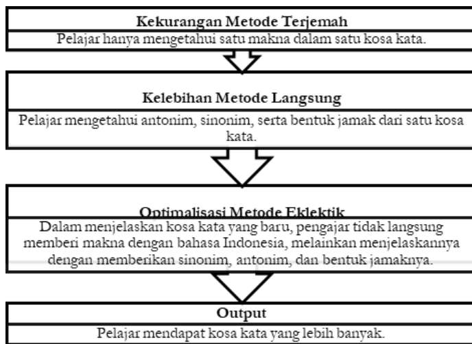
Grafik 2 : Optimalisasi Metode Eklektik (Kekurangan Metode Terjemah dan Kelebihan Metode Langsung)

Sebagaimana metode langsung, metode terjemah juga memiliki kekurangan. Kekurangan metode terjemah menurut pengajar Lembaga Kursus Bahasa Arab Al-Fitrah ialah penerjemahan kosa kata atau teks ke dalam bahasa Indonesia akan membatasi pelajar dalam pemerolehan kosa kata bahasa Arab. Misalnya, penerjemahan kata baitun (bahasa Arab) dengan kata rumah (dalam bahasa Indonesia). Pelajar hanya akan mengetahui kata baitun yang maknanya rumah. Untuk menghindari kekurangan dari metode terjemah tersebut, maka pengajar mendahulukan menggunakan metode langsung dari pada metode terjemah. Dengan menggunakan metode langsung, diharapkan pelajar dapat menguasai kosa kata lebih banyak dan terbiasa mendengar pengucapan bahasa Arab.