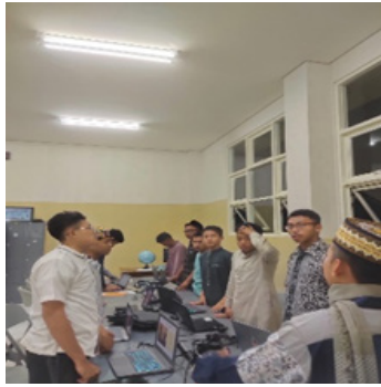
الشكل ٨: يختم المعلم الدرس بتقييم نتائج عملية التعليم التي تم تنفيذها.

في نهاية الجلسة التعليمية، عادةً ما يقوم المعلمون بتلخيص مضمون المادة والجلسة مع الدرس القادم. يمكن أن يساعد تقديم ملاحظات أو واجبات بسيطة في تقوية فهم الطلاب للمادة التي تم تدريسها. سيقدم المعلم الجيد أيضًا ملاحظات بناءة، ويحث الطلاب على مواصلة التعلم، ويخلق بيئة تدعم تطوير مهارات التفكير النقدي والثقة بالنفس. وهذا ما يؤكدده الشكل ٨ الذي يوضح ذلك: