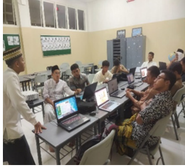
الشكل ٢: افتتاح التعليم بمدرس اللغة العربية في مدرسة الحكمة الثانوية الإسلامي العالمي باتو

يوضح الشكل ٢ أنه في فصل دراسي مملوء بالنشاط والحيوية، تقف المعلم أمام السبورة مستعد لبدء درس اليوم. وبابتسامة لطيفة، ترحّب بالطلاب، مما يخلق حالة من الحماسة والشعور بالراحة. عيناه تلمعان، مما يدل على حماسه للمادة التي سيلقيها. بدأ المعلم بطرح الأسئلة الإرشادية وإثارة اهتمام الطلاب وإثارة فضولهم ودعوتهم إلى التفكير النقدي. كان صوته واضحًا وواثقًا، مما جذب اهتمام كل طالب في الغرفة.