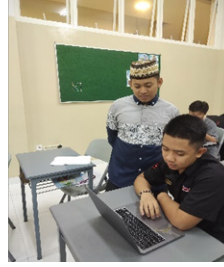
صورة ٦، ٧: يقدم المعلم المساعدة للطلاب الذين يواجهون صعوبات في تعلم مهارة الكلام باستخدام كتاب "العربية بين يديك الجزء الأول".

يوضح الشكلان ٦ و٧ أنه يمكن للمعلمين تقديم المساعدة من خلال مقارنة خاصة أكثر تخصيصاً، مثل إعطاء تفسيرات إضافية أو أمثلة ملموسة ذات صلة بالمادة التي يتم تعلمها. على سبيل المثال، إذا واجه الطالب صعوبة في فهم بنية جملة معينة، يمكن للمعلم تقديم المزيد من الأمثلة على استخدام تلك البنية في سياقات مختلفة. بالإضافة إلى ذلك، يمكن للمدرسين دعوة الطلاب إلى التدرب على المحادثات في مجموعات صغيرة أو بشكل زوجي، حتى يشعروا بمزيد من الثقة ويحصلوا على تعليقات مباشرة من أقرانهم.