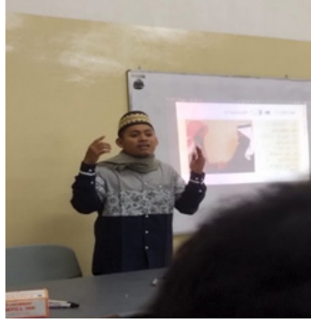
الشكل ٣: المعلم يشرح مادة التدريس للطلاب

يوضح الشكل ٣ أن المعلم لا يكتفي بإعطاء الحقائق والنظريات فحسب، بل يقوم أيضاً بإحياء الموضوع بأمثلة واقعية ذات صلة بحياة الطلاب اليومية. ويستخدم وسائل بصرية مختلفة، مثل الصور ومقاطع الفيديو والرسوم البيانية، لتوضيح المفاهيم المختلفة والمعقدة. وفي بعض الأحيان، يلقي بعض المزاح الخفيف، مما يجعل جو الفصل الدراسي أكثر ارتياحاً واستمتاعاً. لا يكتفي المعلم بالتدريس فحسب، بل يُلهم الطلاب ويشجعهم على التعلم بحماسة وسرور.