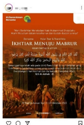
Gambar 3. Contoh komodifikasi ayat Al-Qur'an sebagai teknik marketing biro haji dan umroh di platform sosial media Instagram.