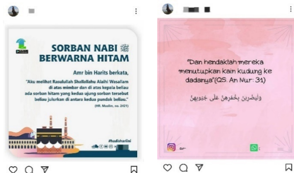
Gambar 1. Contoh komodifikasi ayat Al-Qur'an sebagai teknik marketing jilbab di platform sosial media Instagram.

Gambar tersebut merupakan contoh komodifikasi yang terjadi di Indonesia. Melihat fakta bahwa Indonesia merupakan negara berpenduduk Muslim terbanyak di dunia, penjual yang memasarkan produk jilbabnya memanfaatkan ayat Al-Qur'an, yakni Qs. An-Nur ayat 31, dimana ayat tersebut merupakan perintah bagi seorang Muslimah untuk menutup aurat atau mengenakan jilbab hingga menutupi dadanya. Si penjual menggunakan dalil tersebut untuk menarik pelanggan -dalam hal ini adalah seseorang yang beragama Islam- agar membeli produk dagangannya.