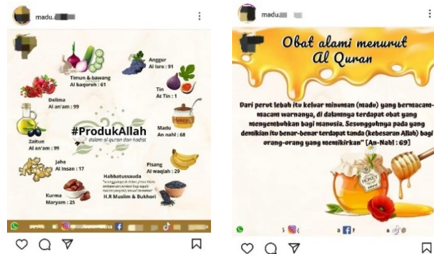
Gambar 2. Contoh komodifikasi ayat Al-Qur'an sebagai teknik marketing madu di platform sosial media Instagram.

Senada dengan penjual jilbab pada gambar sebelumnya, gambar diatas juga menunjukkan contoh komodifikasi ayat Al-Qur'an dalam penjualan madu. Si penjual mengutip Qs. An-Nahl ayat 69, yang menjelaskan tentang minuman yang keluar dari perut lebah, sebagai iklan untuk memasarkan madunya, agar pembeli (terutama yang beragama Islam) tertarik untuk membelinya. Si penjual seakan-akan mengatakan bahwa "Allah telah memberikan Obat alami berupa madu, mari beli disini".