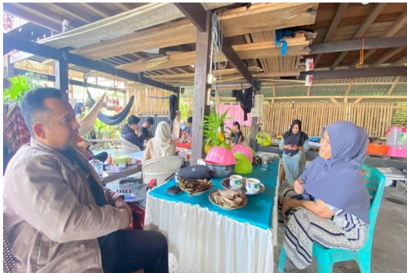
Gambar 1.2 Wawancara Bersama Penduduk Desa Toabo

Selanjutnya, kami juga mengidentifikasi bahwa kesetaraan merupakan salah satu faktor kunci yang berkontribusi terhadap keberhasilan moderasi beragama di Desa Toabo. Kesetaraan tercermin melalui akses yang merata terhadap sumber daya bagi masyarakat dengan beragam latar belakang agama. Selain itu, praktik pembagian kekuasaan dalam struktur pemerintahan desa menunjukkan pendekatan inklusif yang merangkul seluruh kelompok masyarakat tanpa diskriminasi. Menurut salah satu warga yang kami wawancarai, dalam instansi pemerintahan desa Toabo selalu diupayakan agar aparatnya bisa mencerminkan keterwakilan tiap-tiap agama yang ada di Toabo (Darma, komunikasi pribadi, 27 Desember 2024). Pendekatan ini tidak hanya menciptakan rasa keadilan sosial, tetapi juga memperkuat kohesi antarwarga yang pada gilirannya mendukung terciptanya harmoni sosial di desa tersebut.