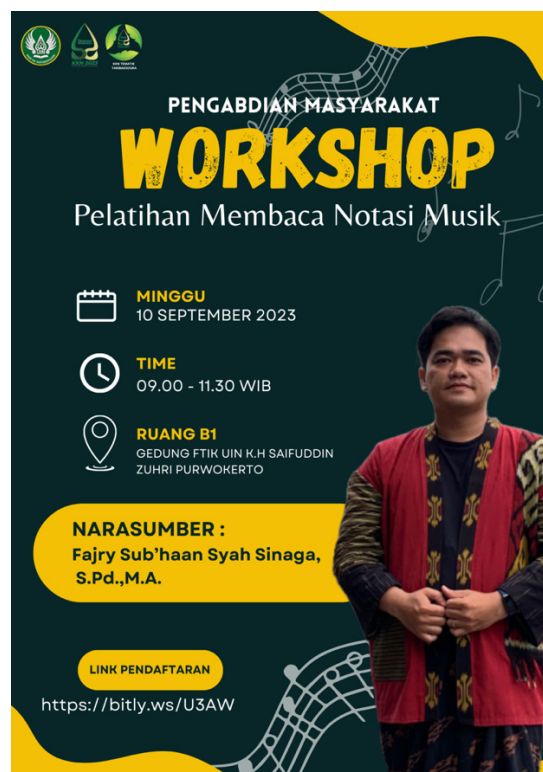
Gambar 6. Flyer Kegiatan Workshop Pelatihan Membaca Notasi Musik (Dosen Pengabdian dan Tim KKN Tematik)

Minggu, 10 September 2023 diselenggarakan workshop pelatihan membaca notasi musik yang diselenggarakan di Laboratorium Musik UIN Saizu Purwokerto dengan peserta dari pelaku seni, kelompok seni, pelajar, hingga pemuda yang tertarik pada Seni Kentongan.