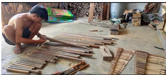
Gambar 3. Tahap awal melakukan Pemilahan Bambu (Dosen Pengabdian dan Tim KKN Tematik)

Berikut adalah dokumentasi dari proses pembuatan set tek-tek kentongan yang dilakukan oleh Sanggar Bumi Nada Banyumas mulai dari awal hingga pengepakan untuk selanjutnya dilakukan pengiriman.