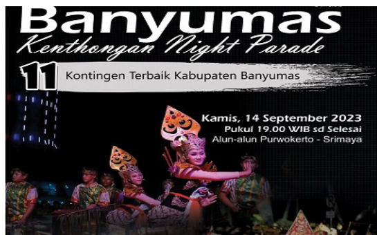
Gambar 7. Flyer Kegiatan Banyumas Kenthongan Night Parade

Kamis, 14 September 2023 Tim Pengabdian melakukan pendampingan pada acara Banyumas Kenthongan Night Parade 2023 di Alun-alun Purwokerto. Beberapa anggota seni bergabung dalam kelompok seni yang mewakili kecamatan Sumbang yaitu Sari Kedeling Laras (SKL).