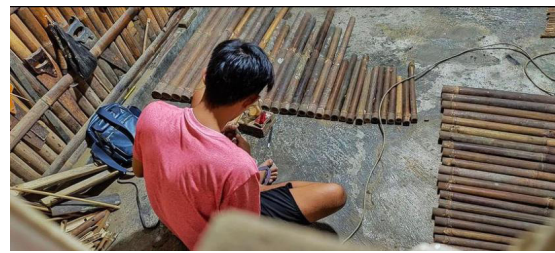
Gambar 4. Tahap Kedua melakukan tuning notasi (Dosen Pengabdian dan Tim KKN Tematik)