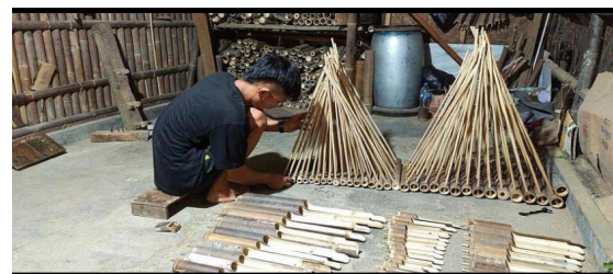
Gambar 5. Tahap ketiga menyatukan Bilah Bambu membentuk Angklung (Dosen Pengabdian dan Tim KKN Tematik)