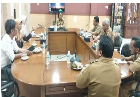
Gambar 4. Mendiskusikan Smart Village