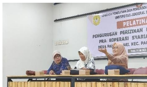
Gambar 6. Pelatihan

Program yang dilaksanakan dalam mendukung kegiatan tersebut tim Penyegaran dan Penguatan Kelembagaan bagi anggota BUMDes dan Pokdarwis Desa Pandansari Kecamatan Paguyangan Brebes, Pembentukan Pra Koperasi Syariah, Cek Lokasi, yang akan dibuat gerai UMKM dan Souvenir Pelatihan Pengurusan Perizinan dan pembentukan Pra Koperasi Syariah bagi UMKM dan Penyerahan Website kepada Desa. Program tahun pertama yang telah dilakukan adalah penggalan potensi desa,