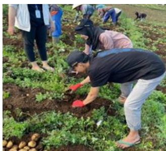
Gambar 1. Dan Gambar 2. Kondisi Alamnya

Desa mempunyai potensi yang seharusnya bisa menjadi peluang untuk bisa dikembangkan dalam menjangkani pariwisata, antara lain: kentang, kambing sakup dan wisata alam. Namun, tingkat pemahaman dan menangkap peluang serta kesadaran wisata pada masyarakat secara umum masih perlu ditingkatkan. Harapannya, dengan adanya persamaan pemahaman, adanya keikutsertaan masyarakat sekitar akan tertarik ikut menunjang pembangunan pariwisata dan mendapatkan manfaat yang positif. Namun, pada kenyataan yang terjadi sampai sekarang belum seperti yang diharapkan. Seringkali dalam melayani keperluan wisatawan yang mengunjungi suatu daerah tujuan wisata, belum paham apa yang harus dilakukan. Sehingga kegiatan ini akan memberikan pemahaman kepada masyarakat bahwa harus mampu untuk menangkap peluang tersebut.