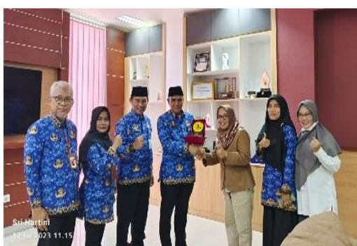
Gambar 5. Kerjasama