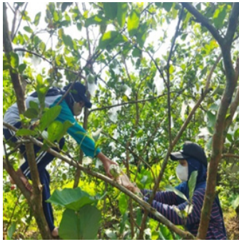
Gambar 4. Gambar Batang dan Ranting Pohon