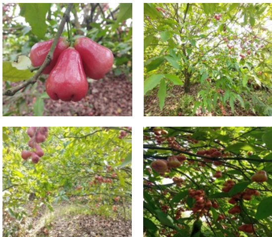
Gambar 1. Gambar Karakteristik Jambu citra