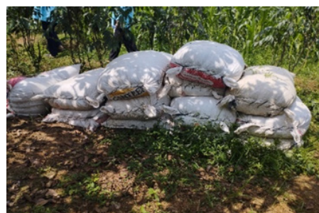
Gambar 8. Gambar Pupuk Kandang