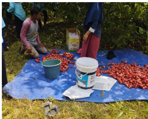
Gambar 10. Gambar Panen Jambu Citra