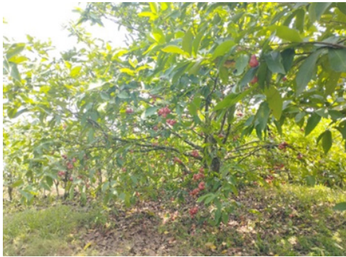
Gambar 9. Gambar Pohon Jambu Citra