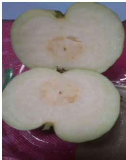
Gambar 5. Gambar Daging Buah