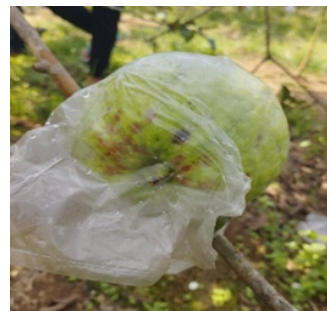
Gambar 3. Gambar Jambu Menggunakan Pupuk Organik