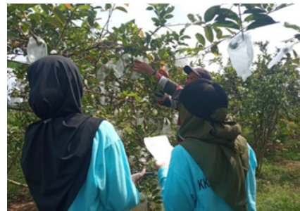
Gambar 6. Gambar Wawancara

menggunakan pupuk organik juga disarankan menggunakan pupuk kimia supaya hasil panen buah yang diperoleh dapat maksimal sesuai harapan. Kemudian hendaknya masyarakat di desa Karanggedang tersebut memanfaatkan hasil alam jambu lokal dengan inovasi produk siap saji agar memiliki nilai jual yang lebih tinggi yang otomatis otomatis akan meningkatkan kesejahteraan ekonomi masyarakat.