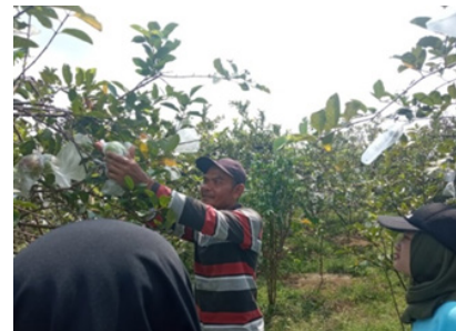
Gambar 7. Gambar Pemetikan Jambu Kristal