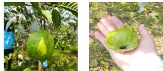
Gambar 2. Gambar Jambu Menggunakan Pupuk Kimia