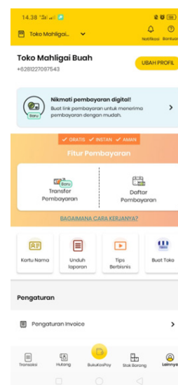
Gambar 2 Aplikasi Akuntansi BukuKas

Setelah dipertimbangkan pengabdian memilih aplikasi BukuKas sebagai sistem akuntansi yang akan diterapkan. Pertimbangan dari pemilihan aplikasi ini adalah kemudahan akses aplikasi, tampilan yang mudah dipahami, mudah dioperasikan bagi pemula, sistem sudah terotomatisasi, dan dapat mencetak laporan keuangan. Pemilik Toko Mahligai Buah tidak dipusingkan dengan nama-nama akun dalam pencatatan akuntansi sesuai keinginannya. Kemudahan yang diberikan oleh aplikasi BukuKas sudah sesuai dengan apa yang diharapkan oleh pemilik Toko Mahligai Buah.