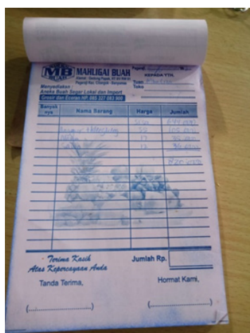
Gambar 1 Bukti Kwintansi Toko Mahligai Buah

Pada minggu pertama pengabdian melakukan pengamatan operasional dan analisa terhadap data-data yang tersedia. Pengabdian mengumpulkan beberapa dokumen untuk menjadi bahan pengabdian yang kemudian diolah untuk menentukan kebutuhan pemilik Toko Mahligai Buah. Di akhir pekan data yang sudah dianalisa sesuai metode PAR kemudian di sampaikan kepada pemilik toko. Untuk selanjutnya ditentukan tujuan yang akan dicapai bersama dan dilakukan persiapan. Tahap persiapan ini meliputi pengadaan alat dan bahan antara lain handphone, beberapa bukti catatan, bolpoint.