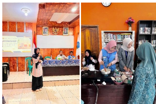
Gambar 3. Penyampaian Materi Teori dan Praktik Tim Pengabdian

permasalahan masyarakat khususnya ibu rumah tangga. Selain berdampak pada kesehatan, minyak jelantah juga berpengaruh buruk terhadap lingkungan. Minyak bekas yang dibuang sembarangan tidak dapat terurai secara alami sehingga memerlukan penanganan khusus. Oleh karena itu, penting untuk meningkatkan kesadaran masyarakat mengenai cara mengolah atau mendaur ulang minyak jelantah agar lebih bermanfaat, salah satunya dengan menjadikan lilin aromaterapi, produk yang kini diminati oleh anak muda maupun orangtua sebagai sarana relaksasi dan pengharum ruangan.