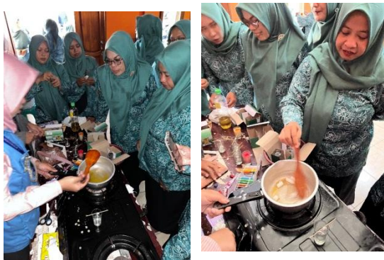
Gambar 2. Proses Pembuatan Lilin Aromaterapi oleh Mitra Pengabdian

pembuangan minyak jelantah secara sembarangan ke tanah maupun perairan dapat menyebabkan pencemaran lingkungan. Erna & Wiwit (2017) menyatakan bahwa minyak jelantah yang dibuang ke saluran air, sungai, atau tanah dapat merusak ekosistem perairan serta menurunkan kualitas tanah. Pernyataan ini diperkuat oleh Fransisca (2011) yang mengemukakan bahwa pembuangan minyak jelantah ke badan air berpotensi meningkatkan kadar Chemical Oxygen Demand (COD) dan Biological Oxygen Demand (BOD) . Kondisi tersebut terjadi karena terbentuknya lapisan minyak dipermukaan air yang menghambat penetrasi cahaya matahari, sehingga organisme perairan tidak dapat bertahan hidup dan keseimbangan ekosistem terganggu. Selain itu, pembuangan minyak jelantah ke saluran pembuangan rumah tangga atau ke halaman juga dapat menimbulkan polusi lingkungan serta menurunkan kesuburan tanah. Oleh karena itu, pemahaman mengenai dampak minyak jelantah sangat penting, terutama bagi masyarakat yang tinggal di kawasan pesisir, guna mencegah terjadinya pencemaran laut akibat limbah rumah tangga.