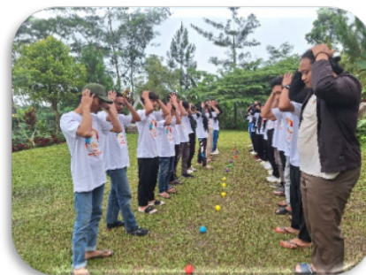
Gambar 3. Potret peserta Youth Interfaith Camp saat mengikuti kegiatan yang didesain dengan pendekatan edutainment

antusiasme peserta (baca: pendekatan pembelajaran edutainment ) (Ulil Albab, 2018). Kegiatan ini bertujuan memberikan edukasi dan pemahaman tentang keberagaman dan toleransi melalui materi, diskusi, dan refleksi.