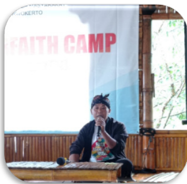
Gambar 4. Ketua Parisada Hindu Dharma Indonesia (PHDI) Banyumas saat mengisi materi harmoni keberagaman dalam perspektif Hindu

Dalam kelas pluralisme pada kegiatan Kemah Pemuda Lintas Iman ( Youth Interfaith Camp ) tersebut, ada beberapa segmentasi materi kelas, diantaranya yaitu materi tentang: 1) penguatan harmoni keberagaman; 2) literasi digital, content creator dan toleransi. Pada sesi ini memberikan materi tentang keberagaman dan keberagaman, dengan tujuan untuk meningkatkan pemahaman dan toleransi antaragama.