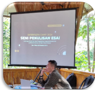
Gambar 5. Penyampaian materi penulisan esai

mendorong peserta untuk menganalisis dan mengevaluasi informasi dari berbagai sudut pandang dan pengalaman.