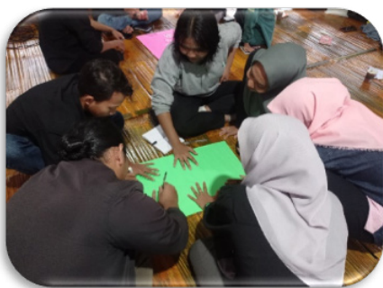
Gambar 6. Peserta bekerjasama membuat mind map atau visualisasi potret keberagaman kita saat ini

Dalam program Kemah Pemuda Lintas Iman ( Youth Interfaith Camp ) ini, para peserta juga tidak hanya membuka dialog tentang permasalahan perbedaan keagamaan dan tentang toleransi saja, namun peserta juga diajak menganalisa isu-isu sosial dan isu kemanusiaan yang krusial melalui Forum Group Discussion (FGD). Dengan adanya perbedaan agama tersebut tidak lantas menghambat mereka untuk untuk menjalin kerjasama, kolaborasi dan sinergi untuk tujuan sosial dan kemanusiaan.