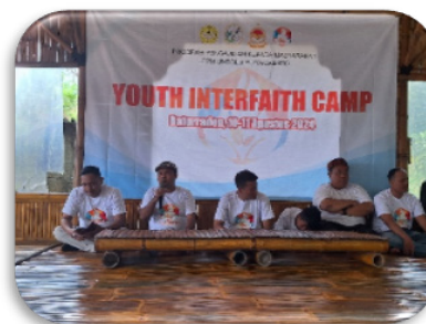
Gambar 2. Tim PkM saat memberikan materi harmoni dalam beragama

Kelas pluralisme merupakan sebuah konsep dalam pendidikan yang mengajarkan nilai-nilai keberagaman, toleransi, dan saling menghargai antar berbagai latar belakang budaya, agama, dan pandangan. Dalam kelas pluralisme, peserta diajarkan untuk memahami dan menghormati perbedaan yang ada di masyarakat (Ulul Huda, Imam Suhardi, 2022).