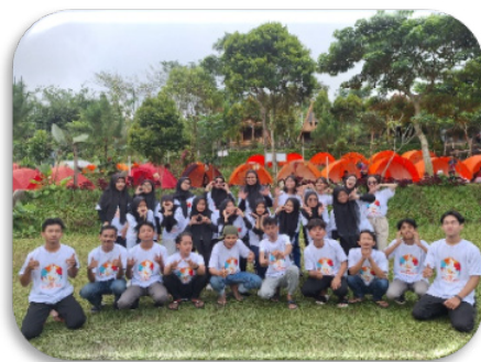
Gambar 10. Potret peserta di akhir sesi kegiatan

Adapun ada beberapa poin implikasi atau dampak dari kegiatan Kemah Pemuda Lintas Iman ( Youth Interfaith Camp ), di antaranya yaitu: 1) meningkatkan pemahaman dan toleransi antar agama; 2) membangun kerjasama dan komunikasi antar peserta; 3) menguatkan rasa toleransi dan harmonitas antar umat beragama; 4) meningkatkan kesadaran dan tanggungjawab sosial; 5) menumbuhkan inklusivitas dalam beragama; 6) membentuk santri yang moderat dan berwawasan luas.