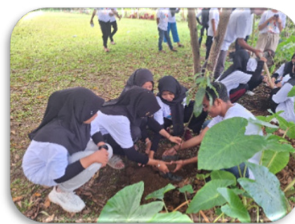
Gambar 9. Kegiatan tanam pohon dan edukasi lingkungan

Adapun pada kegiatan tanam pohon, peserta belajar tentang pentingnya peran pohon dalam ekosistem. Edukasi tentang manfaat pohon—seperti penyedia oksigen, perlindungan tanah, dan sumber pangan—dapat membangkitkan kesadaran akan tanggung jawab lingkungan. Kegiatan ini juga mengajarkan nilai-nilai kepedulian dan kerja sama antaranggota masyarakat.