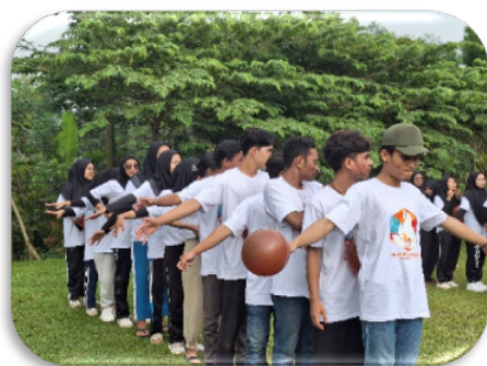
Gambar 8. Kegiatan outbond

Atas dasar tersebut peserta Kemah Pemuda Lintas Iman ( Youth Interfaith Camp ) juga diajak untuk menanam pohon bersama-sama di alam terbuka. Kegiatan tersebut sekaligus menjadi bagian dari kegiatan outbond di hari terakhir kemah. Kegiatan outbond dirancang untuk membangun kerjasama, komunikasi, dan semangat kebersamaan antar peserta, melalui permainan dan aktivitas yang menyenangkan.