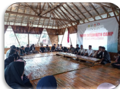
Gambar 1. Pembukaan Acara Kemah Pemuda Lintas Iman ( Youth Interfaith Camp )

Adapun pelaksanaan Kemah Pemuda Lintas Iman ( Youth Interfaith Camp ) dilaksanakan pada tanggal 10 - 11 Agustus di Area Camp Gudel, Baturaden, Kabupaten Banyumas.