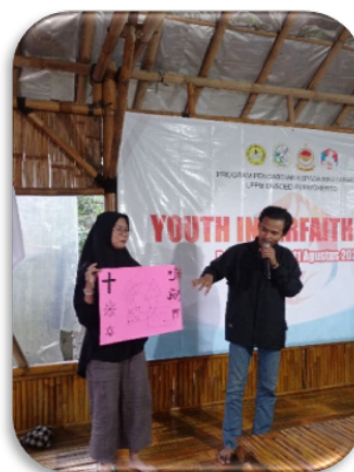
Gambar 7. Peserta mempresentasikan hasil maping dan diskusi kelompoknya masing-masing

Problem yang sering muncul ke permukaan saat ini, seringkali orang-orang menggembor-nggemborkan isu keagamaan yang bertendensi memecah belah, namun sering lupa melihat bahwa problem sosial yang lebih krusial terabaikan. Jadi dalam kegiatan program Kemah Pemuda Lintas Iman ( Youth Interfaith Camp ) ini muaranya adalah memperkuat relasi harmoni lintas agama, yang kemudian berimplikasi pada penguatan kerjasama, kolaborasi dan sinergi, misalnya untuk kegiatan sosial, dialog antar agama, maupun kegiatan lingkungan. Karena selama ini pengalaman santri terkait dengan menjalin relasi pertemanan terutama kerjasama dan kolaborasi dengan teman-teman yang beragama selain Islam itu tergolong masih minim dan jarang.