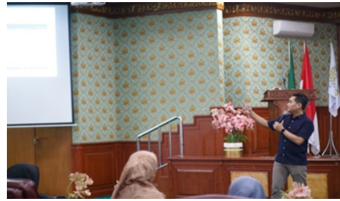
Gambar 2. Implementasi Kegiatan

Kegiatan ini dilaksanakan pada tanggal 12 Desember 2023. Peserta dalam kegiatan ini adalah mahasiswa Universitas Islam Negeri Sultan Syarif Kasim Riau yang memiliki potensi untuk mempublikasikan karya tulis ilmiah di jurnal bereputasi. Kegiatan ini diawali dengan memperkenalkan Sinta kepada para peserta. Hal ini dilakukan karena tidak semua peserta mengenal platform ini. Sinta merupakan platform yang dikelola oleh Kementerian Pendidikan dan Kebudayaan Republik Indonesia (Santosa & Agung, 2017). Sinta dirancang untuk mengindeks dan menilai jurnal, artikel, dan publikasi ilmiah dari berbagai disiplin ilmu di Indonesia. Sinta bertujuan untuk meningkatkan kualitas publikasi ilmiah dan memajukan penelitian di Indonesia. Sinta memiliki tiga fungsi utama, antara lain: