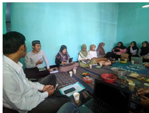
Gambar 3. Dokumentasi Pelatihan Literasi Media dan Digital Bersama Mahasiswa PGMI UNU Purwokerto