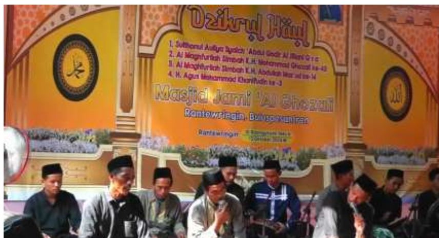
Gambar 5. Acara Dzikrul Haul diadakan setiap tanggal 10 Robingutsani (satu tahun sekali) 13 Oktober 2024