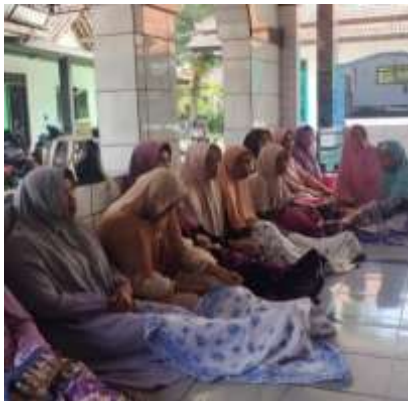
Pengikut Jamaah Tarekat