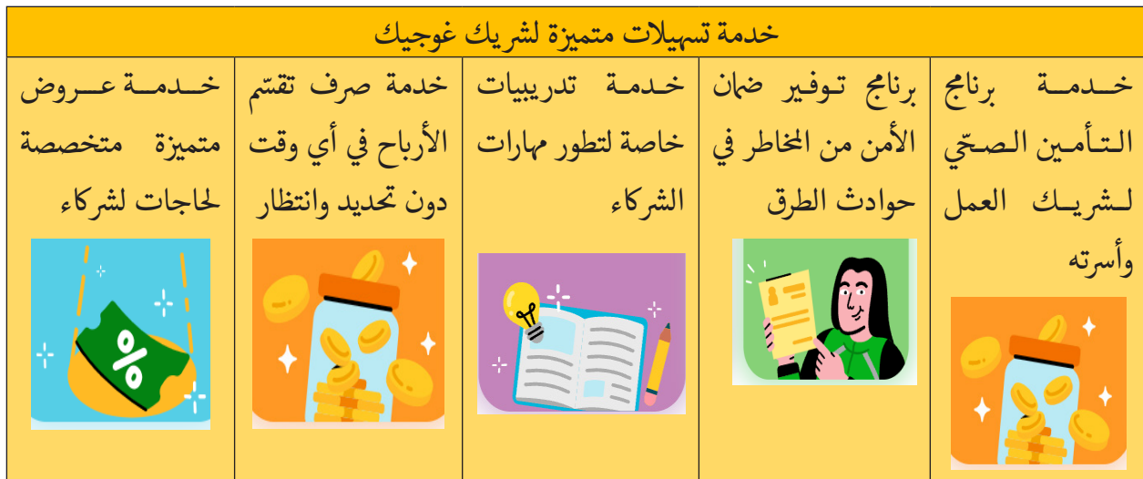
القائمة 1 تسهيلات متميزة لشريك غوجيك 39

تحديد وانتظار. وكذلك تسهيلات برنامج توفير تدريب متميز على تعلم المهارات للشركاء وتوفير الضمان لحماية الشركاء من المخاطر الناجمة عن حوادث الطرق. وهذه خدمة تسهيلات التي قدمتها شركة غوجيك لشركائها تؤكد على دراسة أريني سلسبيلا بعنوان تنظيم أعمال ضمان السلامة المهنية لسائقي النقل عبر الإنترنت: دراسة تحليلية في شركة غوجيك بمنطقة سورابايا. 38